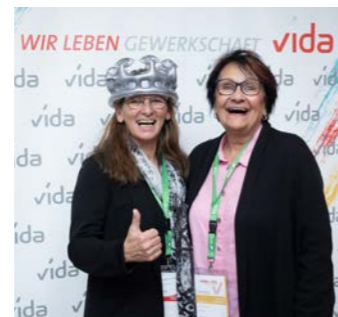
Achtung, in Kürze schließt die Fotobox. Hol dir noch schnell deinen vida-Moment im Bild!