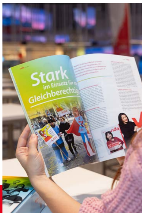
Über 120 Seiten geballte vida-Power findest du in unserem Berichtsmagazin – mit den Highlights der letzten fünf Jahre unserer vida.