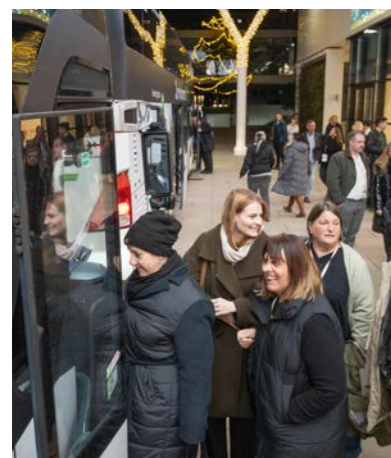
Alle einsteigen bitte! Gestern Abend ging es noch zum großen Bürgermeister-Empfang ins Wiener Rathaus.