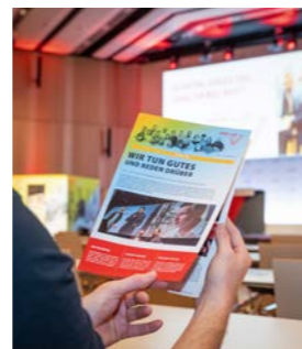
Da schau her! Die erste Ausgabe unserer Kongresszeitung ist bei uns im Austria Center angekommen!