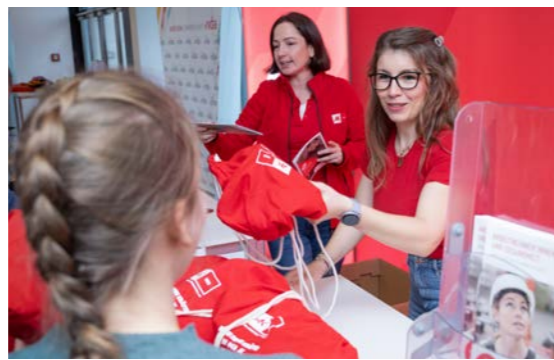
Das Messe-ABC für unsere Delegierten: Von AK über ÖBV und SPARDA bis vidaversum. Schau heute noch vorbei!

VIEL BERICHTET UND DISKUTIERT WURDE GESTERN IM AUSTRIA CENTER. DANKE an alle, die den 5. vida-Gewerkschaftstag mit Leben erfüllt haben. Viele Highlights findest du auf gewerkschaftstag.vida.at . Werde Teil unserer Social Media Wall – poste deinen Beitrag mit #mehrvida und #vidagwt2024 .