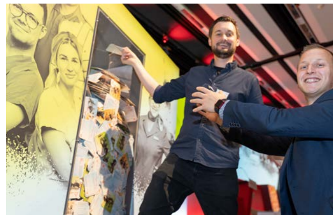
Was heißt mehr vida für dich? Sag es uns! Unsere große Mitmachbox wartet auf dich bei der großen Gewerkschaftsbühne hier im Austria Center.