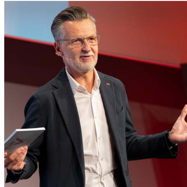
„Die Gewerkschaft steht auf der Seite jener, die sich nicht wehren können. Wir machen sie mächtig für Verhandlungssituationen mit den Mächtigen des Landes.“