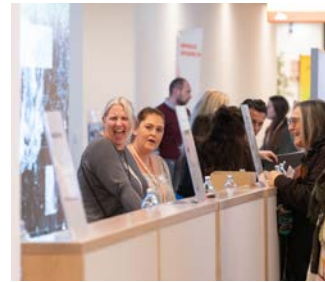
Volles Haus! Das vida-GWT- Organisationsteam steht parat und managt alles von A bis Z.

Herzlich willkommen im Austria Center in Wien, der Geburtsstätte unserer vida. Schön, dass du beim 5. vida-Gewerkschaftstag mit dabei bist!